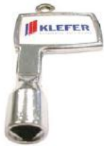
Рис.2 Специальный трехгранный ключ